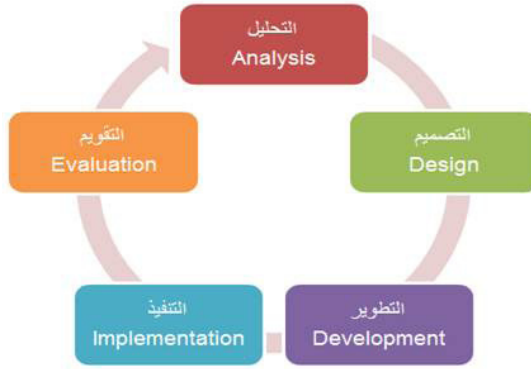
صورة (١): النموذج المرجعي للتصميم التعليمي

نص السؤال على: ما مواصفات البرنامج التدريبي الإلكتروني في استخدام نظام إدارة التعلم (Blackboard) لأعضاء هيئة التدريس في جامعة الأميرة نورة؟ من خلال مراجعة الباحثين لنماذج تصميم برامج التعليم والتدريب الإلكتروني، تم تصميم البرنامج التدريبي الإلكتروني على نظام إدارة التعلم (Blackboard) وفق النموذج العام للتصميم التعليمي (Instructional Design)، ومن أبرز نماذجه نموذج (ADDEI) الذي يتضمن خمس مراحل كما في الشكل التالي: (جستافسون وبرانش، ١٩٩٧).